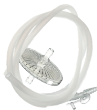
Silikonschlauchset, Art.-Nr.: 033-04820