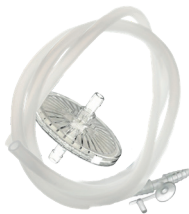
Silikonschlauchset, Art.-Nr.: 033-04820